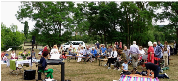
Mainlände- gottesdienst 2025

Am 5. Juli um 10.45 Uhr sind wir an der Mainlände in Eibelstadt mit einem bunten Gottesdienst im Grünen für die ganze Familie. Ob unsere Kirchenmaus Paula auch wieder dabei ist? Wir werden sehen! Bitte Sitzgelegenheit mitbringen!